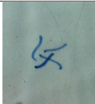
Merk bij plaque afbeelding 1