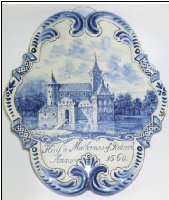
Afbeelding 1, Plaque tinglazuuraardewerk, Makkum, ca. 1909, Afbeelding van Huis te Mathenes of Riviere Anno 1560