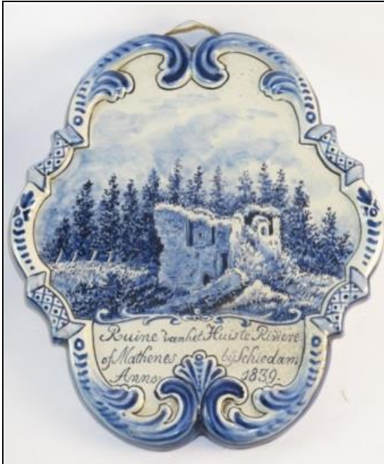
Afbeelding 2, Plaque tinglazuuraardewerk, Makkum, 1909, Afbeelding van Ruine van het Huis te Riviere of Mathenes bij Schiedam Anno 1839